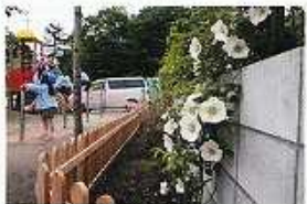
右) 寄贈先の施設に贈られる院遊プレート(一例) 左) 寄贈先の一つ八千代市の高津幼稚園

貝殻亭リゾートイベント情報 ● バラの苗一般無料配布会 5/27,28,29 12:00~ ● 苗づくり勉強会 5/30 12:00~ ● ナニワイバラ写真・絵画展 7~8月 11:00~ ソレイユ2Fカフェ ☎047-481-6227