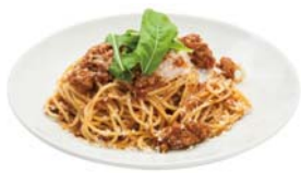
牛挽き肉のボロネーゼ