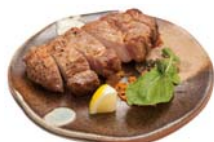
ヤマニ味噌マリネ豚ロース