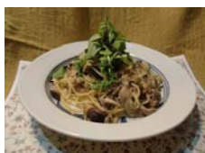
ポルチーニのカルボナーラ