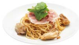
牡蠣と生ハムのペペロンチーノ