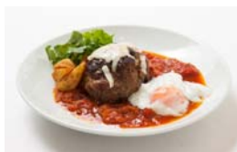
手ごねハンバーグ