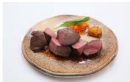
和牛ハツのサイコロステーキ