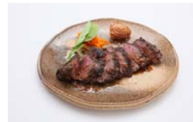
バベットステーキ