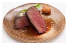
アングス牛のステーキ