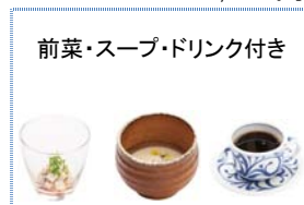
前菜・スープ・ドリンク付き