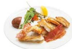
本日の魚のグリル