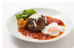
手ごねハンバーグ