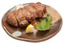
ヤマニ味噌マリネ豚ロース