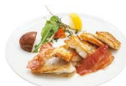
本日の魚のグリル