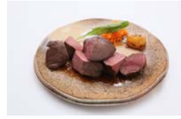
和牛ハツのサイコロステーキ