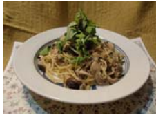
ポルチーニのカルボナーラ