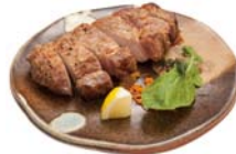
ヤマニ味噌 豚ロースのグリル