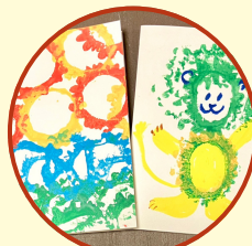
ゴーヤの輪切りスタンプ オリジナルカード