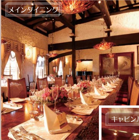
メインダイニング (40名様まで)【左】 キャビンルーム (30名様まで)【右】

※食材の入荷状況により内容が変更になる場合もございます。 ※ご要望に応じて、フリードリンクプランもお付けいただけます。 2時間 大人お一人様¥2,500(税別) / お子様お一人様¥1,000(税別) (ビール・ワイン・ノンアルコールビール・ノンアルコールカクテル・ソフトドリンク) ※貝殻亭ガーデンにて乾杯&スナップ写真可能