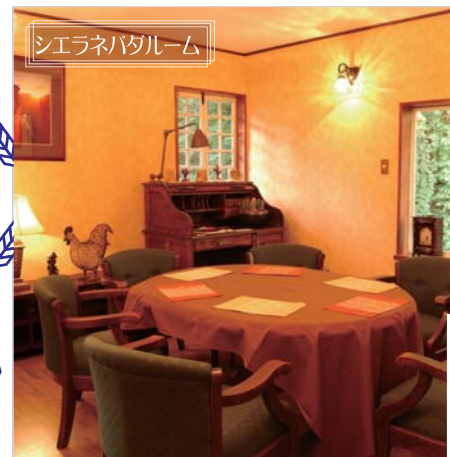
シエラネバダールーム (7名様まで)【左】 京都ルーム (8名様まで)【右】