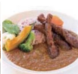
ポーク薬膳カレー セット 1,580円 (単品 1,180円)