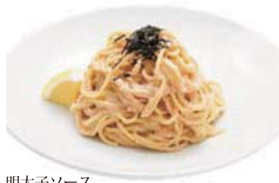
明太子ソース セット 1,280円 (単品 880円)