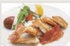
本日の魚グリル例