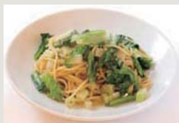
本日のパスタセット例