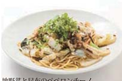
地野菜と昆布のペペロンチーノ セット 1,180円 (単品 780円)