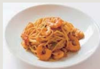
季節のパスタセット例