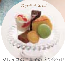
ソレイユのお菓子の盛り合わせ (清祥庵レディースセットのみ)