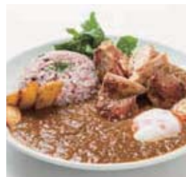
チキン薬膳カレー セット 1,580円 (単品 1,180円)