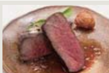
本日の肉グリル例